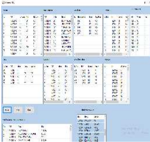
Gambar 5 Form Algoritma KNN

Kemudian ada terdapat beberapa tools yaitu proses. Tampilan menu algoritma KNN dapat dilihat pada gambar 5